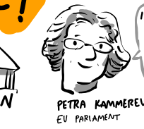
PETRA KAMMERVEERT EU PARLAMENT