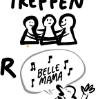
ICH FÜHLE MICH I MAMA